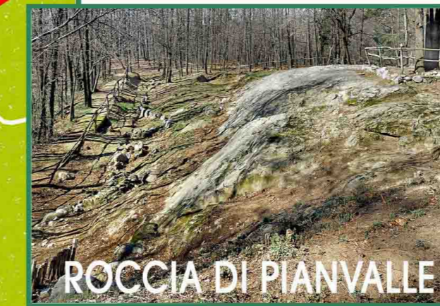
ROCCIA DI PIANVALLE