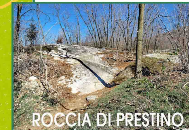
ROCCIA DI PRESTINO